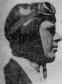
Coronel Ch. A. LINDBERGH